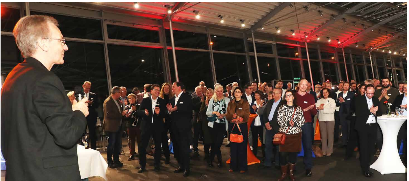
Beim gut besuchten Neujahrsempfang der Wirtschaftsvereinigung Gifhorn intensivierten und knüpften die Teilnehmer Kontakte.

Wer sich vernetzt, bleibt nicht nur informiert – sondern gestaltet aktiv mit.