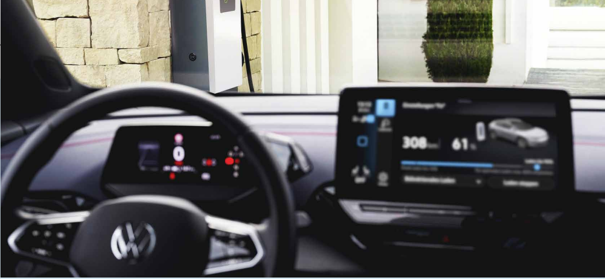
Das bidirektionale Laden gewinnt zunehmend an Bedeutung.

Der Volkswagenkonzern hat zudem bekannt gegeben, dass zukünftig alle ID-Modelle bidirektional laden können. Fahrzeuge mit der 7-kWh-Batterie sollen sukzessive nach entsprechenden Software-Updates (VW-Konzern-Software 3.5) bidirektional laden können. Auch haben die Wolfsburger mit der Firma E3/DC einen ersten Hersteller für kompatible Wallboxen genannt. Denn für das bidirektionale Laden (V2H) im privaten Bereich sind spezielle DC-Wallboxen erforderlich.