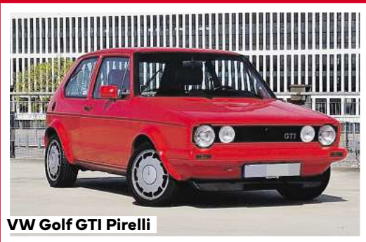
VW Golf GTI Pirelli