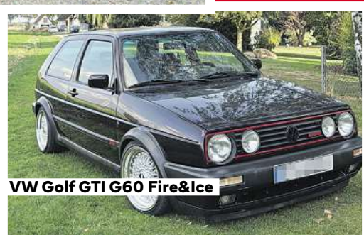
VW Golf GTI G60 Fire&Ice