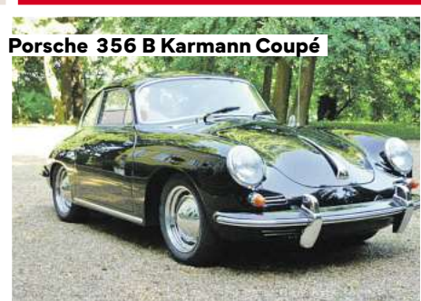
Porsche 356 B Karmann Coupé