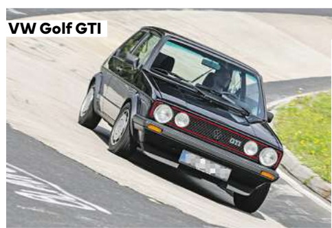
VW Golf GTI