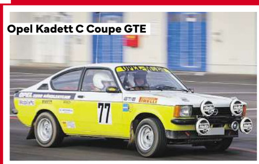
Opel Kadett C Coupe GTE