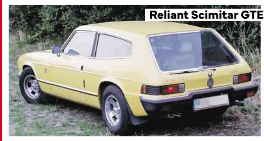
Reliant Scimitar GTE