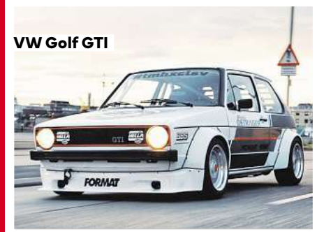
VW Golf GTI