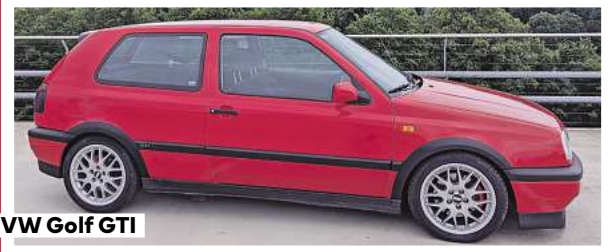
VW Golf GTI