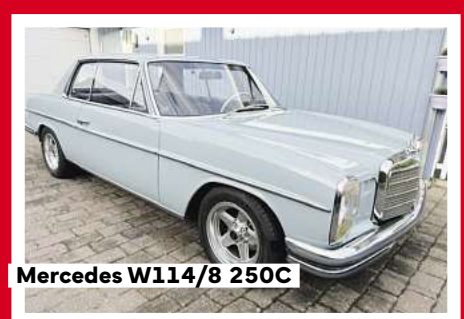
Mercedes W114/8 250C