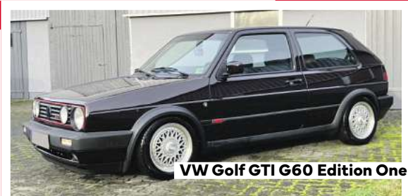
VW Golf GTI G60 Edition One