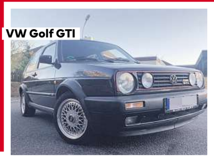
VW Golf GTI