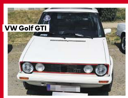
VW Golf GTI