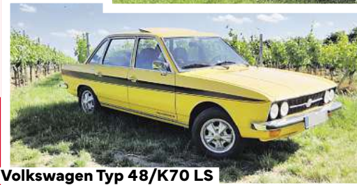
Volkswagen Typ 48/K70 LS