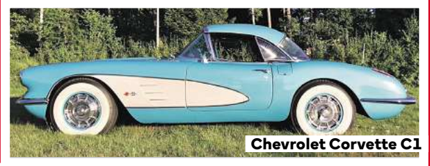
Chevrolet Corvette C1

Diese 17 Fotos liefern einen exemplarischen Ausblick auf ein höchst spannendes Teilnehmerfeld mit rund 200 Fahrzeugen – aufgrund des Jubiläums fahren diverse GTI-Modelle mit, aber auch Raritäten und außergewöhnliche Klassiker werden zu sehen sein.